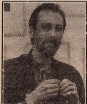
Krasznahorkai László (Gyula, 1954)