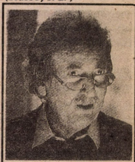
Oskar Pastior (Brassó, 1927)